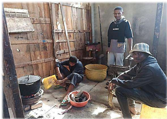
Préparation de la corne : la chauffer pour enlever l'os à l'intérieur