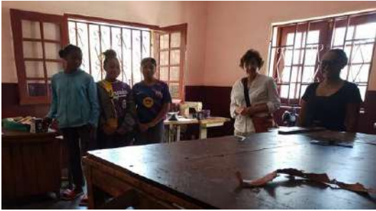
Table de coupe atelier cuir : fabrication de sacs, porte-cartes, portefeuilles