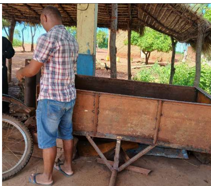
Charrette en cours de réparation