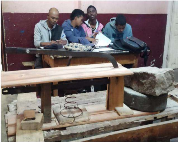
Atelier marqueterie : 4 stagiaires