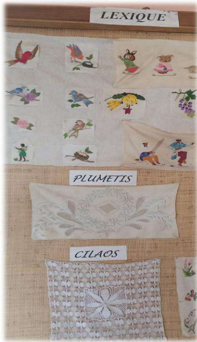
Atelier de Broderie. Travail avec les différents modèles proposés.