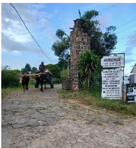
Entrée du domaine Saint François