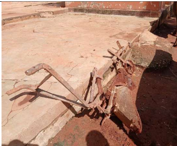
Charrue fabriquée par l'ACA