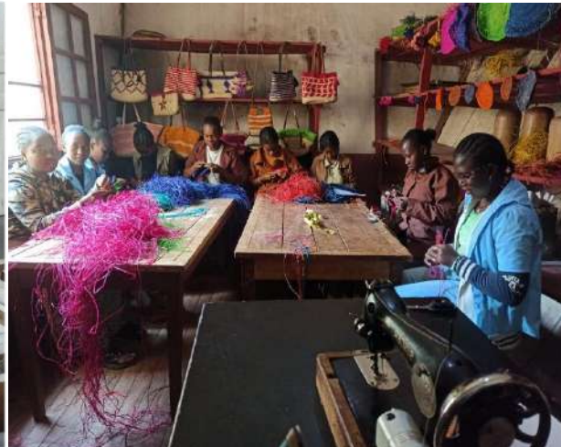
Atelier raphia : tressage sacs, petits tapis, sets de table, chapeaux...