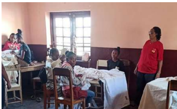
Atelier couture avec la formatrice