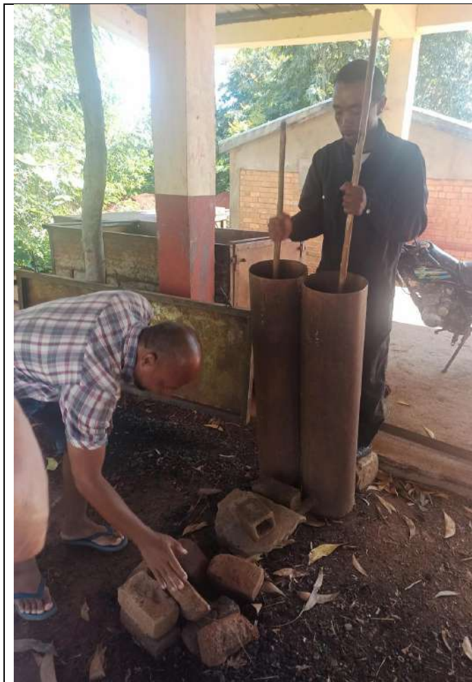
Préparation et soufflerie de la forge