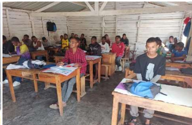
Révision examen plomberie. Un atelier extérieur est dédié à la pratique

Nombreux stagiaires à la section plomberie. Les débouchés pour un emploi sont assez nombreux.