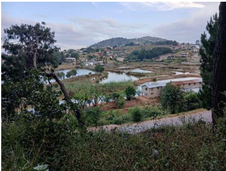
Vue depuis le DSF. Au fond, vers l'église se trouvent les bâtiments ASA, casa1, 2, pré-casa.

Matinée : visite à Antanety avec Cécilien de l'ASA, des lieux à proximité du domaine Saint François.